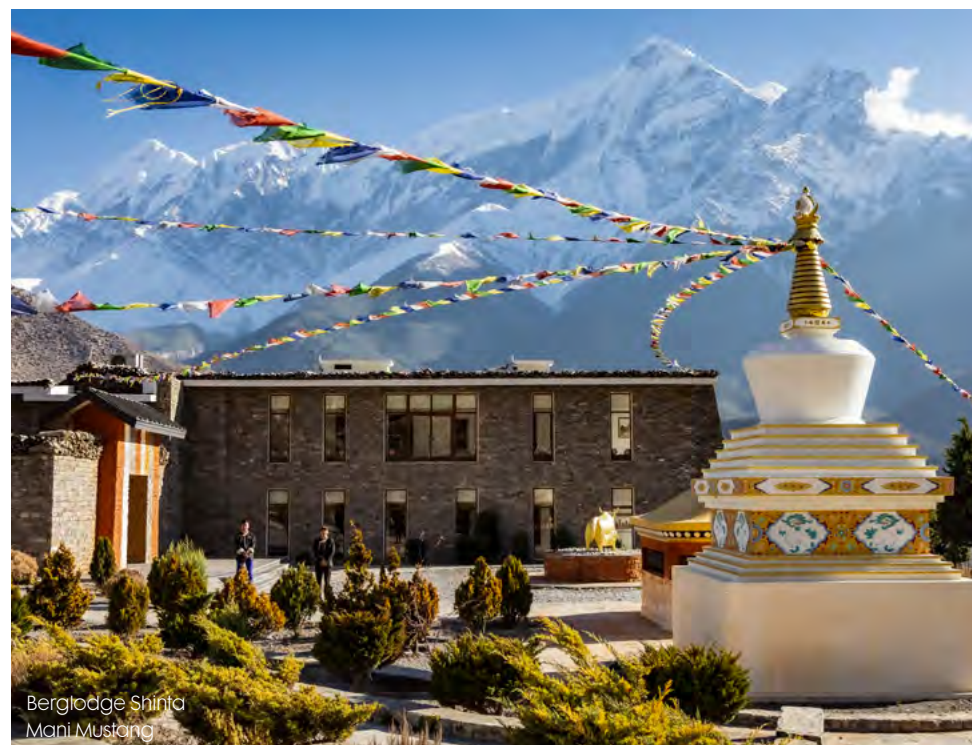
Berglodge Shinta Mani Mustang

mijn ogen, zo overweldigend mooi is het. Ik tuur naar beneden, de diepe kloof in, en kan niet geloven dat dit echt is. Het lijkt wel een decor, een simulatie. Hoe kan dit zo mooi zijn en hoe kan ik hier, als nietig mens, doorheen zweven. Bang ben ik geen seconde meer, ik wil dat deze vlucht nog minstens een uur duurt. Maar dan zijn we er al. We landen. En dan begint het avontuur pas écht.