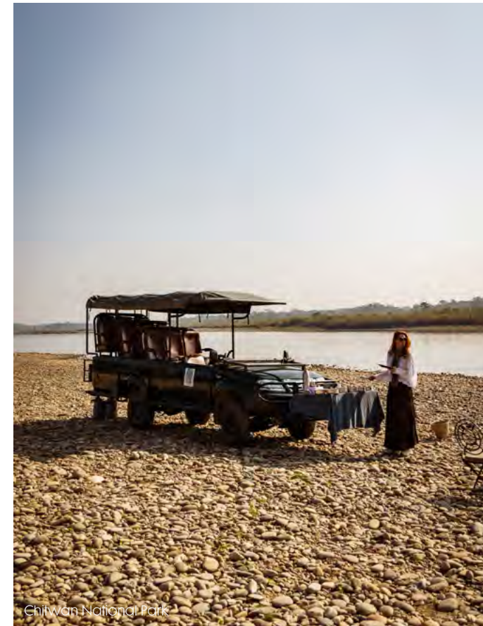
Chitwan National Park

reuzen door vliegt: de Annapurna en de Dhaulagiri, allebei ruim achtduizend meter hoog. Omdat de kloof tegelijkertijd heel smal is en de luchtstromen er verraderlijk zijn, kan er alleen bij windstille gevlogen worden. Rijden vanuit Pokhara kan ook, maar daar doe je zo'n acht uur over omdat de wegen slecht zijn.