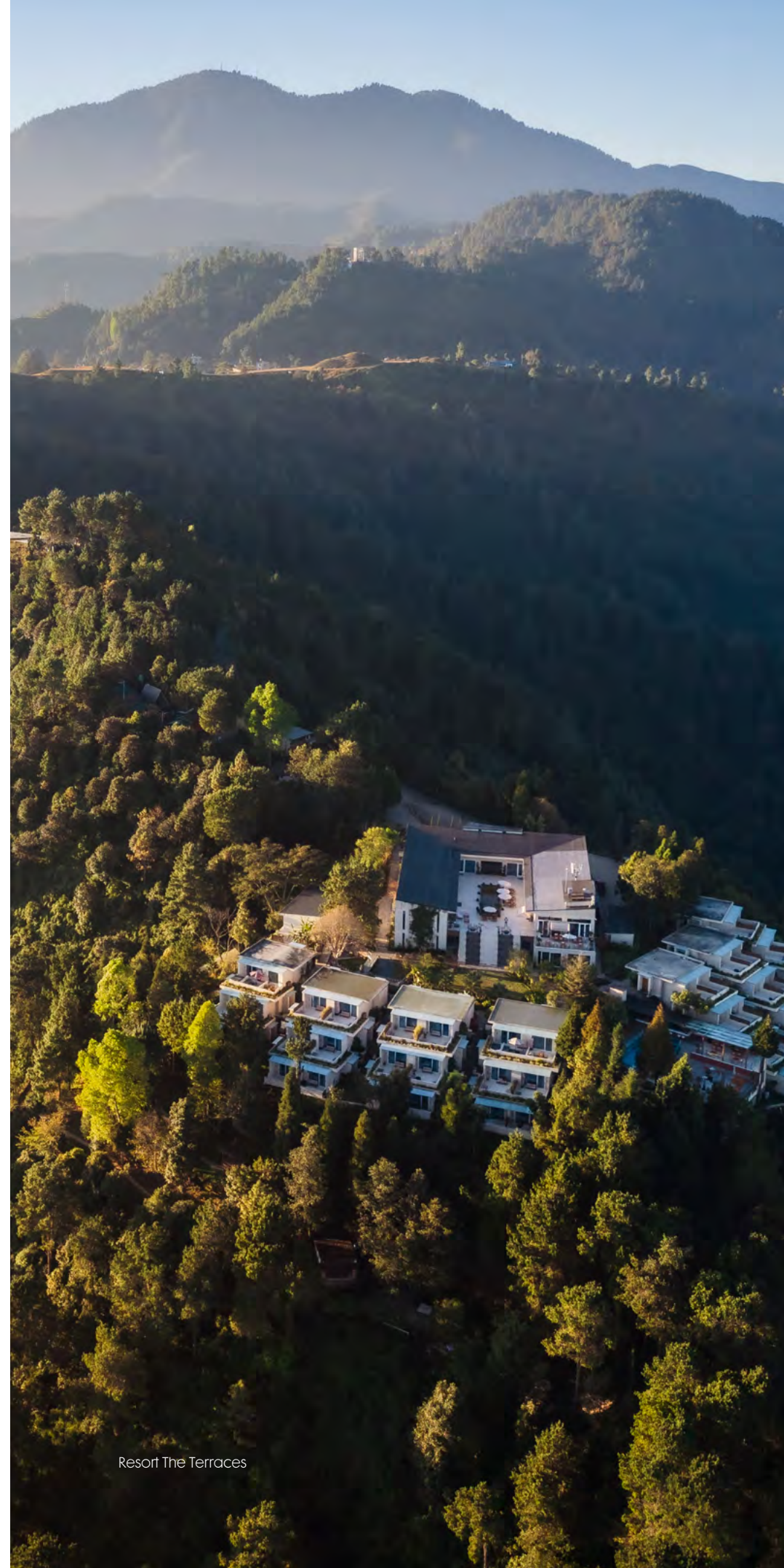
Resort The Terraces

Op mijn laatste dag maak ik nog een – prima te doen – hike naar een klooster boven op een berg, ik tik de 3500 meter hoogte aan. Ik ben een paar grazende jaks voorbijgelopen, maar verder is hier helemaal niemand. Ik wist niet dat leegte zo vervullend kon zijn. Ik heb geen zware trekking hoeven doen, geen dagenlange tocht afgelegd. En toch sta ik hier, in het hart van de humbling Himalaya – waar Nepal zich van zijn puurste en prachtigste kant laat zien. ♥