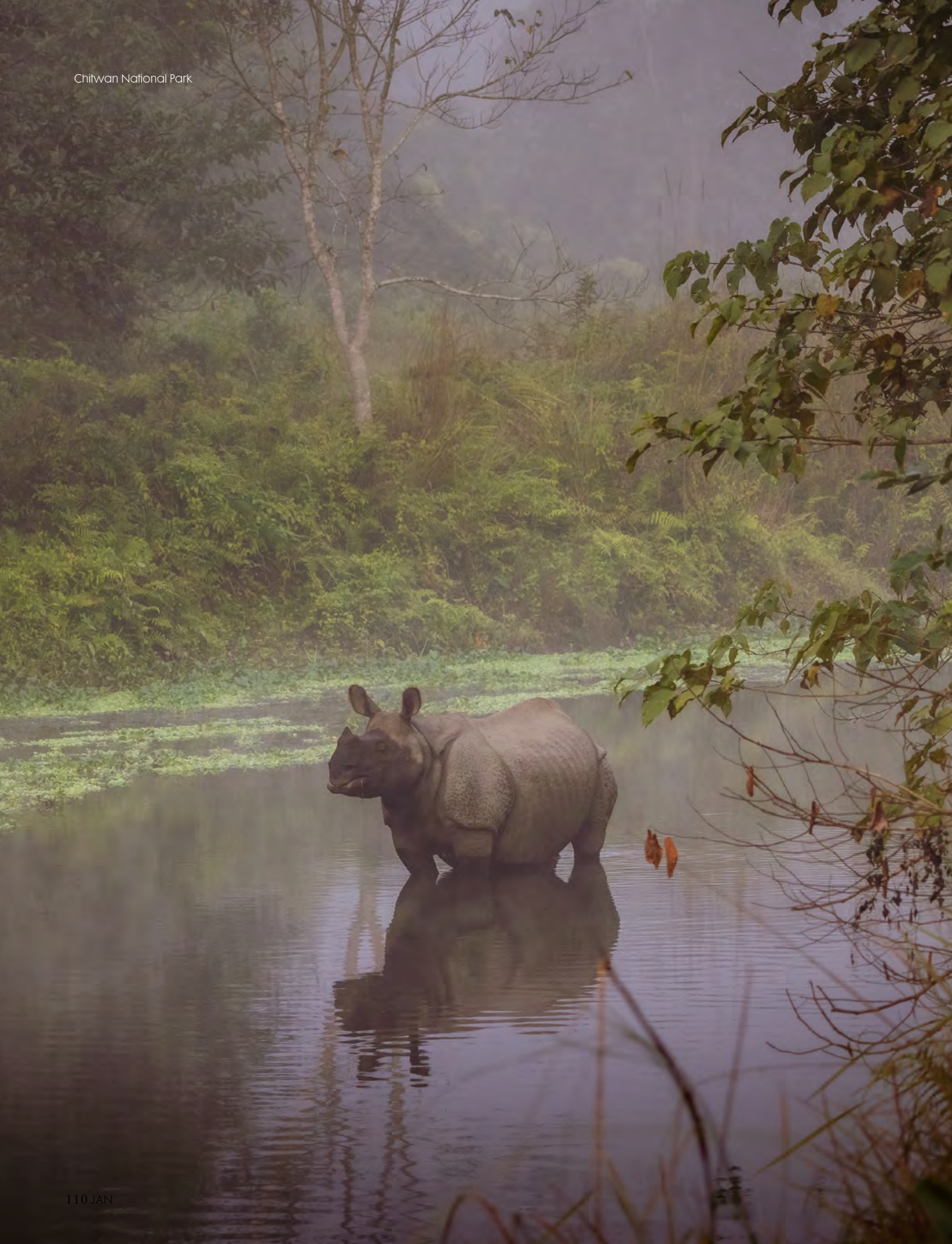
Chitwan National Park